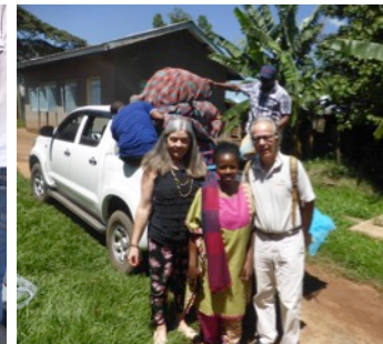
Pick-up für Machame startbereit...