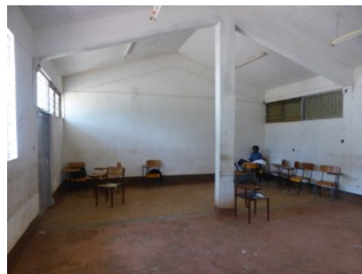
Schulungsraum inkl. Lage unzureichend