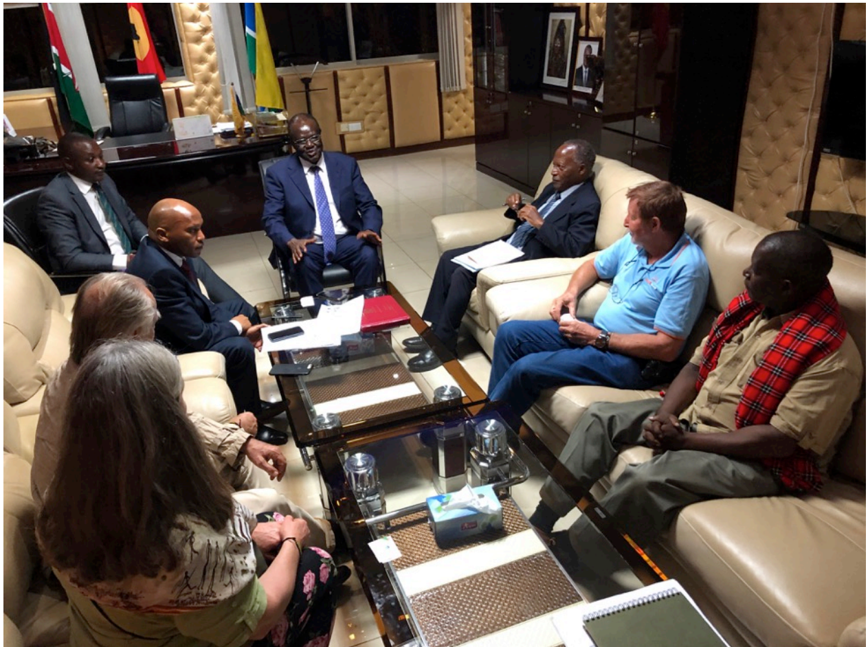
Empfang beim Gouverneur von Meru County, Kenia