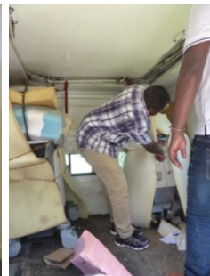
Verlad für Meru...