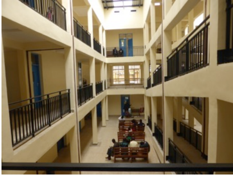
Neubau mit Schulungsräumlichkeiten