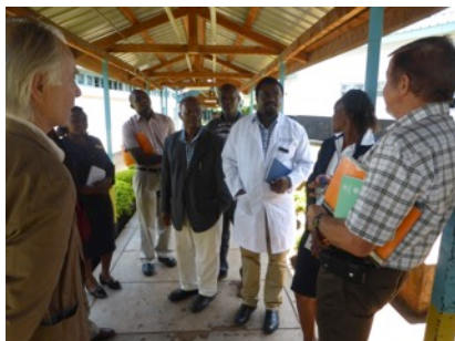
Auf dem Spitalrundgang

Nach Ende der Besprechung im Laufe des Nachmittags und nachdem wir klar betont hatten, dass wir nicht bereit sind, in den uns gezeigten Räumlichkeiten Kurse durchzuführen, berichteten uns die Anwesenden von KeMU, dass sie im Stadtzentrum von Meru, etwa fünf Minuten vom Spital entfernt, über ein Schulungs-Zentrum für Studenten verfügen, das sie uns noch gerne zeigen würden. Was für eine andere Welt! Hier wären die Bedingungen geradezu ideal wenn nicht luxuriös, was Vortragssäle inkl. Übungsräume angeht! Wenn, dann würden wir die Kurse nur hier durchführen, was allerdings bedingen würde, die Schwangeren im Voraus hierher zu bestellen.