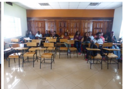
Tiptoppes KeMU Schulungs-Zentrum

So oder so würden wir in Meru vorderhand nur Schwangerschafts-Ultraschallkurse und keine POCUS-Kurse durchführen. Sollte Meru als Kurs-Standort berücksichtigt werden, müsste SmW versuchen, ein zusätzliches Schulungs-Team aufzubauen, da ein Team nicht Mbaya in Tansania und Meru in Kenia bedienen kann. Auch müsste ein MoU erarbeitet werden, das detailliert regelt, welche Aufgaben von welcher Seite verbindlich wahrzunehmen sind.