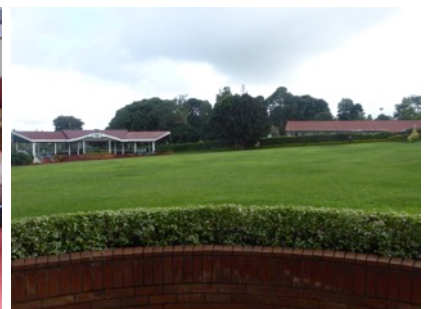
Aussicht vom Büro des Rektors